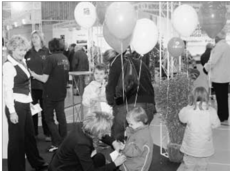
GUT BETREUT Vom kompetenten Service profitierten Gross und Klein.