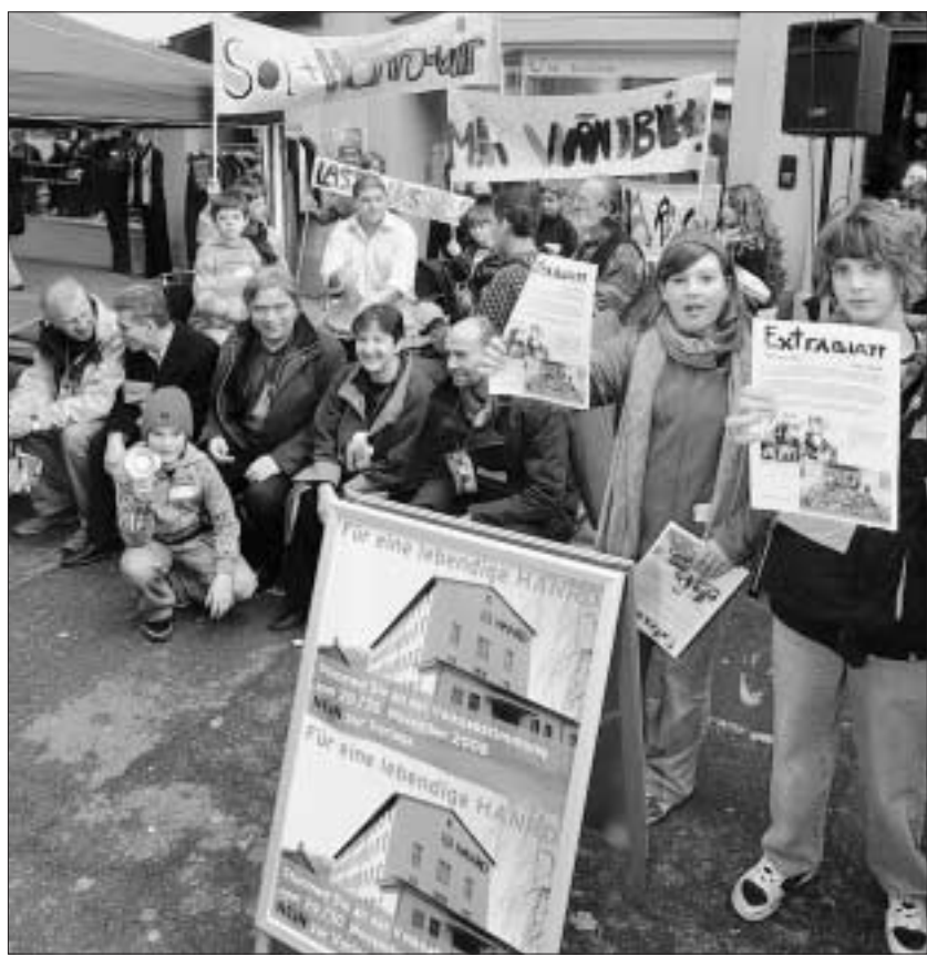
AKTION In der Liestaler Altstadt warben Gewerbler und Künstler für ein Nein zum Quartierplan Hanro, der Ende November zur Abstimmung kommt. KENNETH NARS